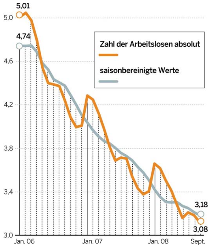
Zahl der Arbeitslosen in Millionen